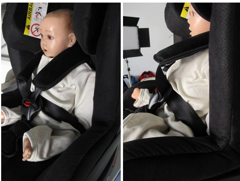
Ilustración 2: En la Hauck Varioguard un recién nacido no queda sujeto de forma segura

La Hauck Varioguard, apta desde el nacimiento, va equipada con arneses de cinco puntos. La altura de las guías de los arneses se puede ajustar al tamaño del niño junto con el reposacabezas integrado. Tirando del regulador central de la correa se puede ajustar el cinturón de tal forma que se ajuste lo más estrechamente posible al cuerpo del bebé. Para los recién nacidos, sin embargo, el arnés no se puede ajustar tanto como para que sujete al niño de forma segura (ver Ilustración 2). Por ello, recibió una calificación de "insuficiente" en cuanto al criterio de ajuste del cinturón del SRI. El reductor de asiento que se menciona en el manual, con el cual se reduce la holgura del cinturón, no se incluía en el producto de prueba que se envió.