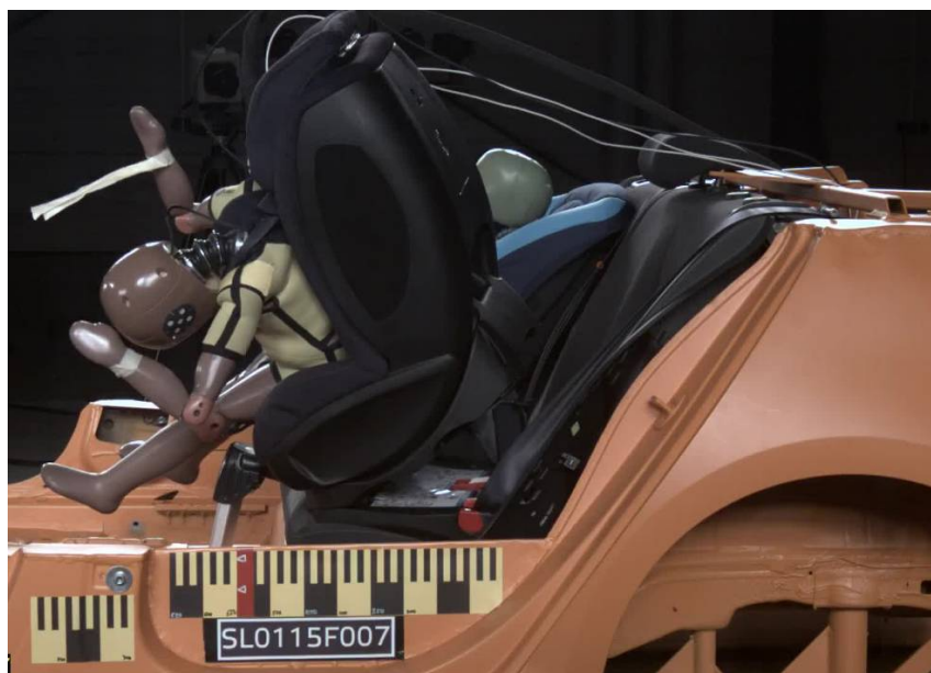
Ilustración 1: En caso de impacto frontal, la Hauck Varioguard se separa de la base asegurada con el cinturón.