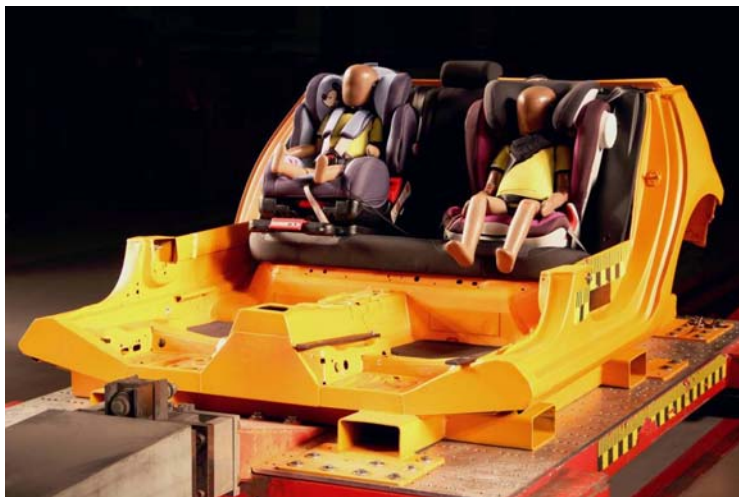
Ilustración 3: Montaje experimental para la prueba de choque frontal