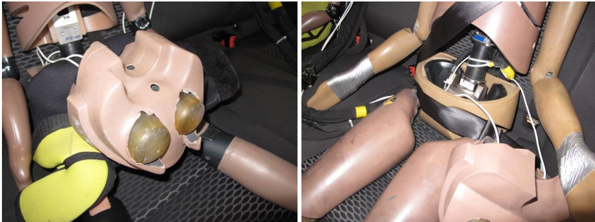
Ilustración 4: Sensores abdominales del dummy Q3

En las pruebas de impacto lateral se realizó un nuevo montaje experimental en el que una puerta invade el habitáculo, desarrollado de acuerdo con la ECE R 129 y en consonancia, también, con las nuevas condiciones que establece el protocolo de pruebas Euro NCAP de 2015. Las principales diferencias de estructura según la ECE R 129 son: